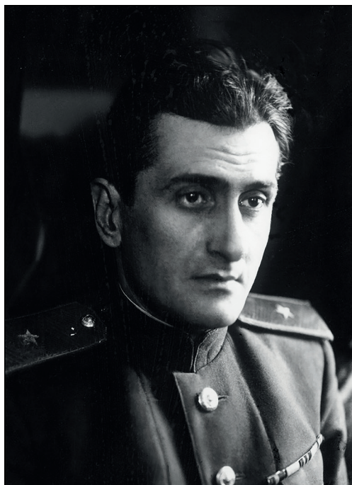
Рисунок 2 – Кнунянц Иван Людвигович – генерал-майор-инженер

В 1935 г. Кнунянцу была присвоена ученая степень кандидата химических наук без защиты диссертации. Спустя четыре года, в 1939 г. в возрасте 33 лет И.Л. Кнунянц защитил докторскую диссертацию. С 1938 по 1954 г. он работал старшим научным сотрудником лаборатории химии гетероциклических соединений Института органической химии АН СССР, а с 1954 г. заведовал лабораторией химии фторорганических соединений Института элементоорганических соединений АН СССР (ИНЭОС). В 1946 г. И.Л. Кнунянца избрали членом-корреспондентом, а в 1953 г. – действительным членом АН СССР. В возрасте 43 лет (1949 г.) Ивану Людвиговичу, начальнику кафедры Военной академии химической защиты имени К.Е.Ворошилова (с 1940 г.), присвоили звание – генерал-майор-инженер (рисунок 2).