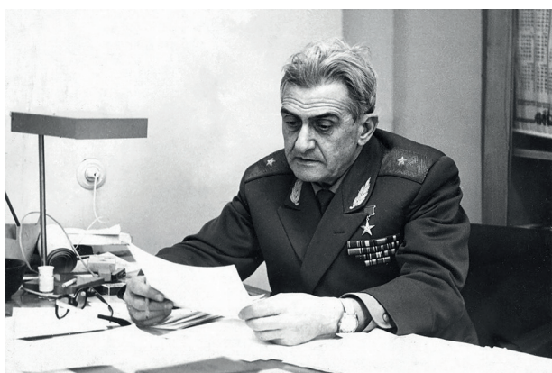
Рисунок 3 – Герой Социалистического Труда И.Л. Кнунянц

Figure 3: Ivan Lyudvigovich Knunyants a Hero of Socialist Labor