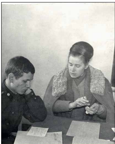
Прием экзаменов, 1973 год