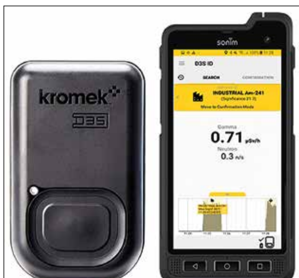
Рисунок 4 – Общий вид прибора серии D3S и отображение на экране мобильного телефона результата его работы

ные из Мэрилендского университета (University of Maryland, США) разработали и испытали метод и устройство поиска РВ на большом расстоянии, которое срабатывает, даже если опасный материал упакован в защитный контейнер. Новый метод заключается в том, чтобы облучать подозрительный объект инфракрасным лазером с длиной волны 3,9 мкм. Новая технология уже прошла лабораторные испытания [3].