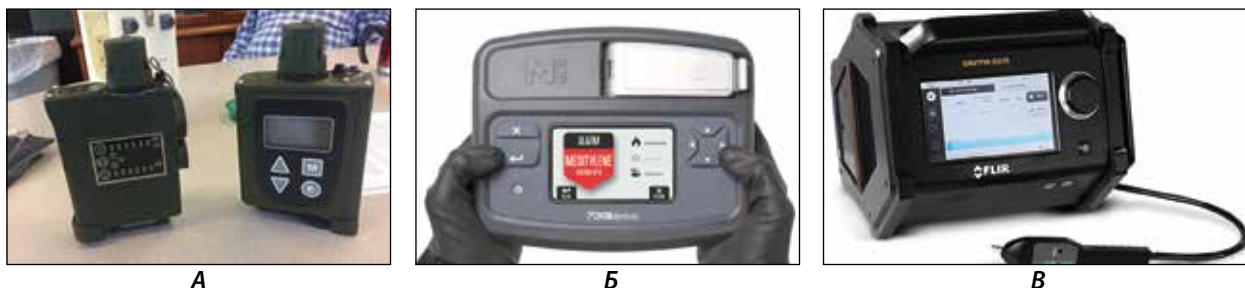
Рисунок 5 – Зарубежные приборы локальной химической разведки.

A – JCAD (США); Б – M908 (США); В – Griffin G510 (США)