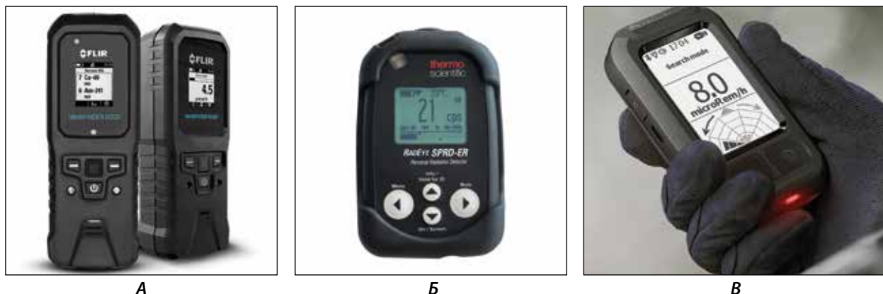
Рисунок 2 – Зарубежные портативные спектрометры ионизирующих излучений.

А – identiFINDER R200 (США); Б – RadEye SPRD-ER (США); В – AccuRad (США)