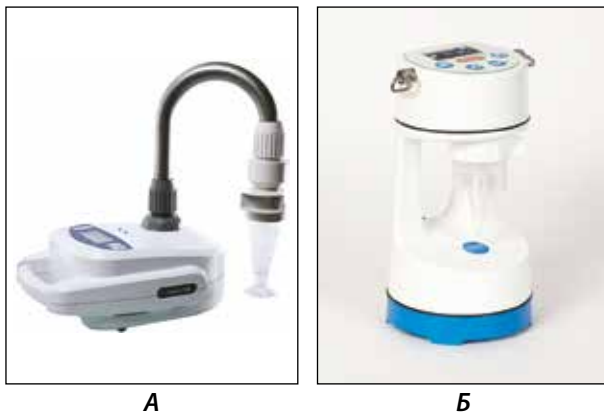
Рисунок 8 – Зарубежные пробоотборники. А – Coriolis \mu (Франция); Б – Coriolis Compact (Франция)