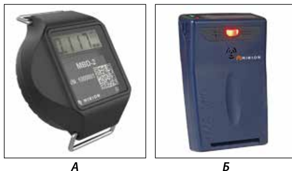
Рисунок 1 – Зарубежные дозиметры.

Анализ современной системы радиационной разведки вооруженных сил ведущих зарубежных стран показывает, что, в основном, она построена на использовании унифицированных приборов. По мнению зарубежных специалистов, такие приборы имеют бесспорные эксплуатационные достоинства перед специализированными приборами и обеспечивают экономические и производственные преиму-