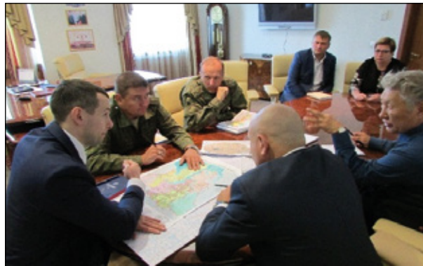
Рисунок 3 – Совещание специалистов ФГБУ «48 ЦНИИ» Минобороны России с представителями органов исполнительной власти Ямало-Ненецкого автономного округа во главе с заместителем губернатора М.Д. Каганом (август 2018 г.)

язве 1 . Для поддержания готовности субъектов Российской Федерации к оперативному реагированию на возникновение чрезвычайной ситуации в области общественного здравоохранения, обусловленной формированием очагов множественных случаев инфекционных заболеваний, вызванных особо опасными возбудителями, необходимо совершенствование оперативных планов работы органов исполнительной власти субъектов Российской Федерации, заинтересованных государственных органов, организаций всех видов подчинения и частных лиц при возникновении указанных чрезвычайных ситуаций 2 .